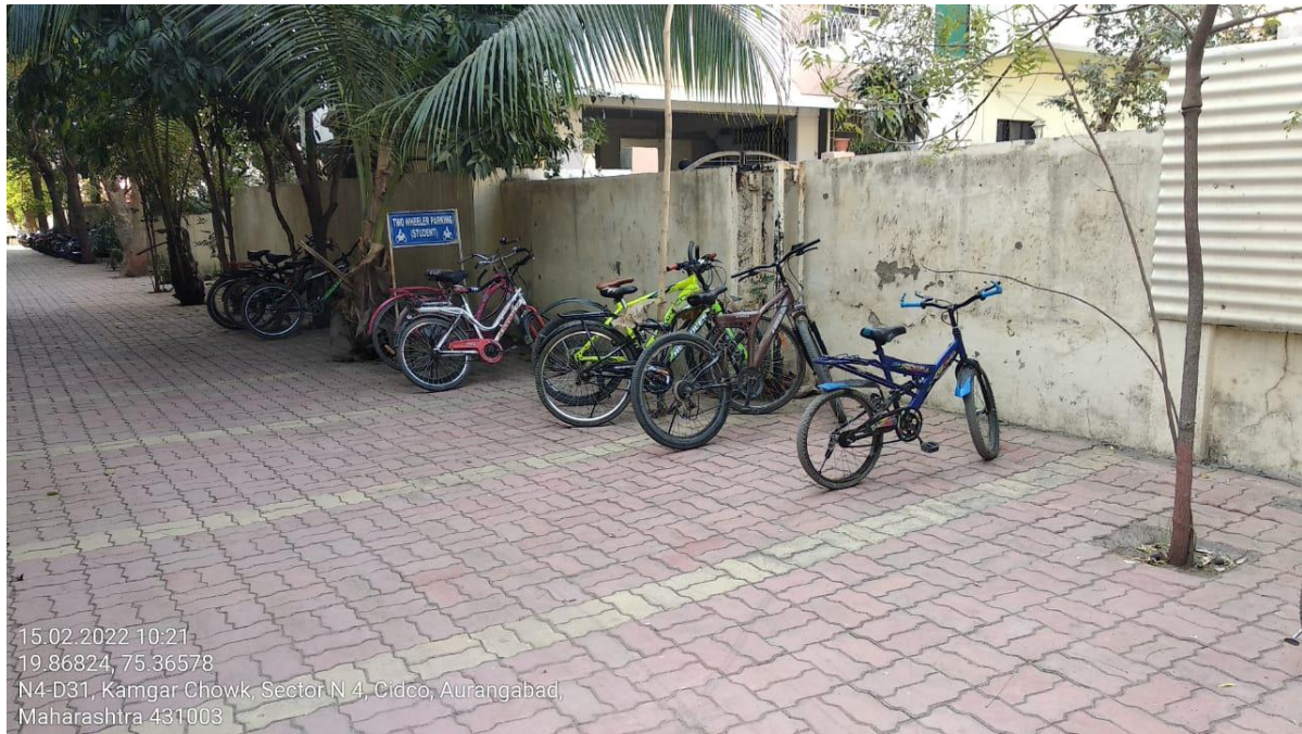
15.02.2022 10:21 19.86824, 75.36578 N4-D31, Kamgar Chowk, Sector N 4, Cidco, Aurangabad, Maharashtra 431003