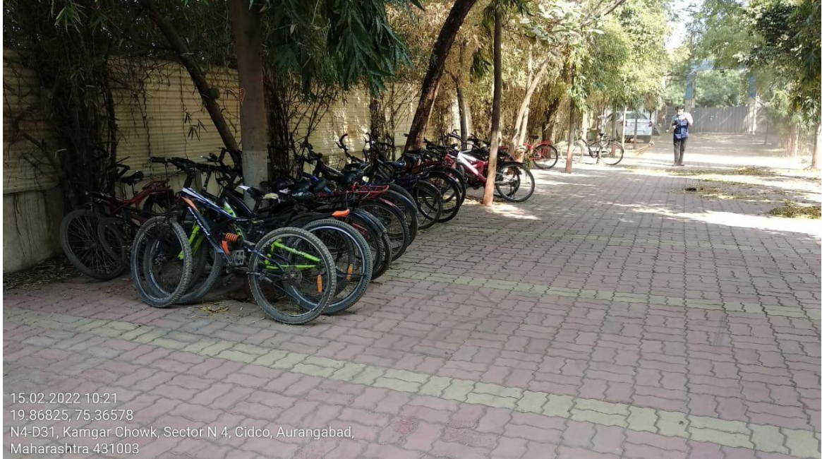
15.02.2022 10:21 19.86825, 75.36578 N4-D31, Kamgar Chowk, Sector N 4, Cidco, Aurangabad, Maharashtra 431003