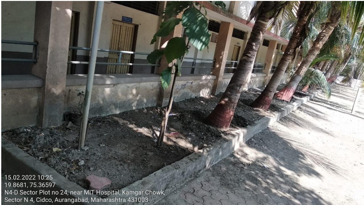
15.02.2022 10:25 19.8681, 75.36597 N4-D Sector Plot no 24, near MIT Hospital, Kamgar Chowk, Sector N 4, Cidco, Aurangabad, Maharashtra 431003