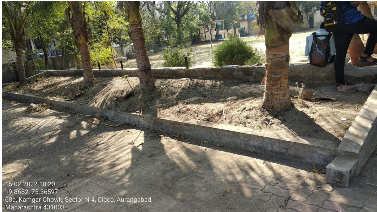
15.02.2022 10:20 19.8682, 75.36597 68a, Kamgar Chowk, Sector N 4, Cidco, Aurangabad, Maharashtra 431003